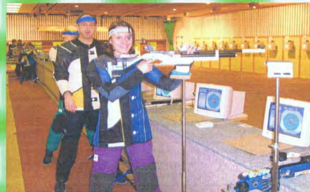
Schießtraining im Leistungszentrum des Oberpfälzer Schützenbundes Pfreimd an elektronischen Schießständen